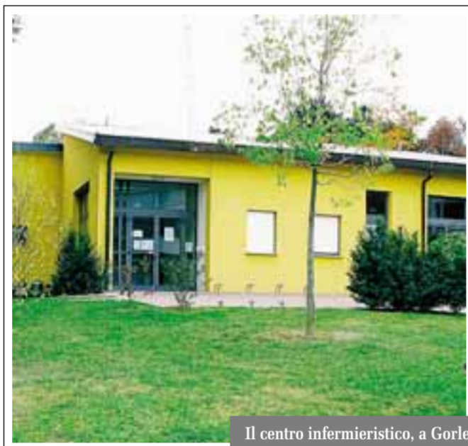
Il centro infermieristico, a Gorle