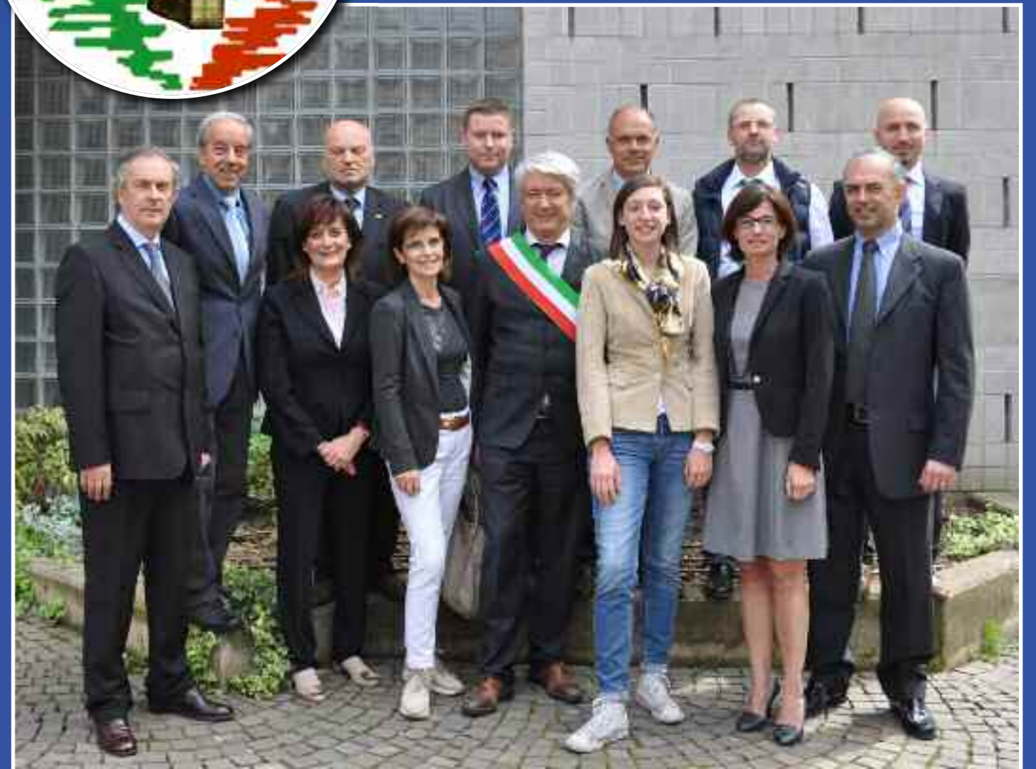
Elezioni 25 maggio 2014

Comunicazione del Gruppo consiliare "La Nostra Gorle" Stampato in proprio - Via Donizetti, 2 - Gorle info@lanostragorle.org Maggio 2014 - n° 42 www.lanostragorle.org