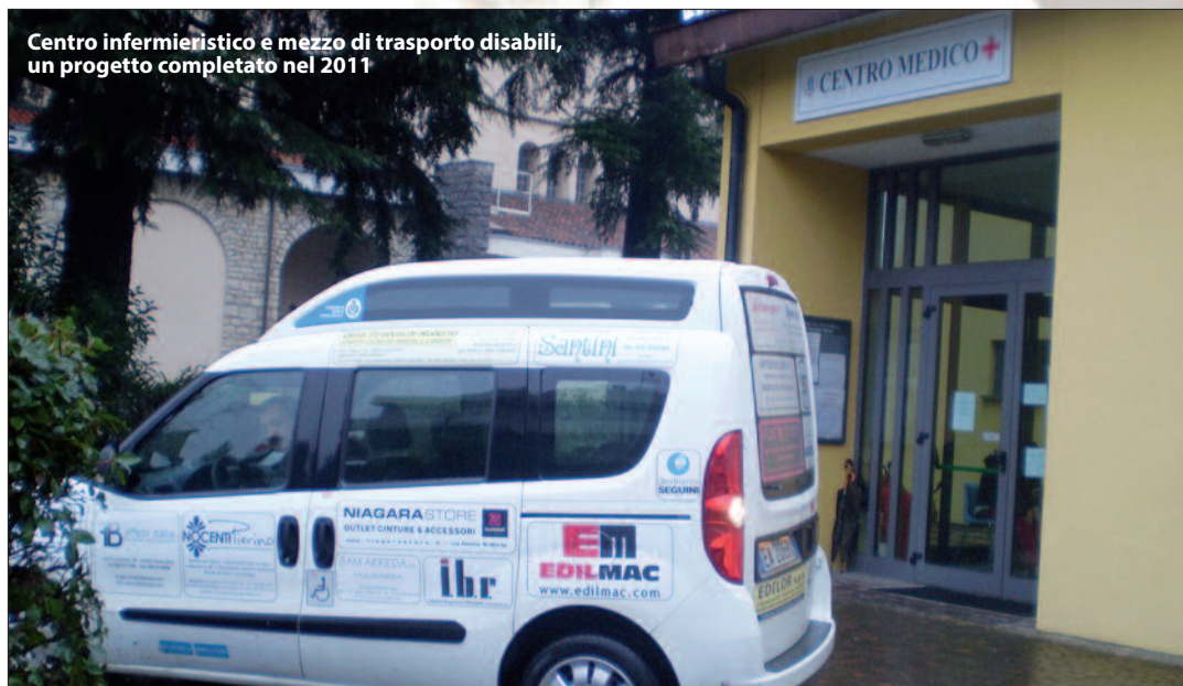
Centro infermieristico e mezzo di trasporto disabili, un progetto completato nel 2011